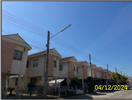
ลักษณะหน่วยพักอาศัย