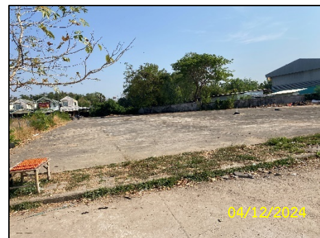
ลานร้านค้าชุมชน