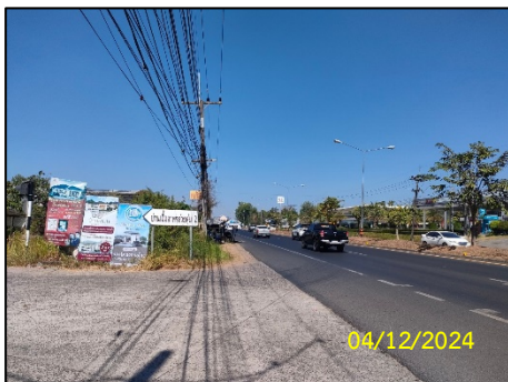
ทิศตะวันออก