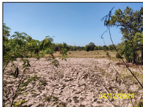
ทิศตะวันตก