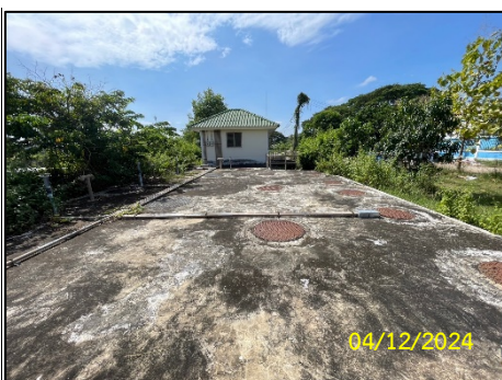
ระบบบำบัดน้ำเสีย