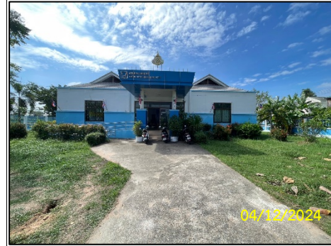
อาคารศูนย์ชุมชน