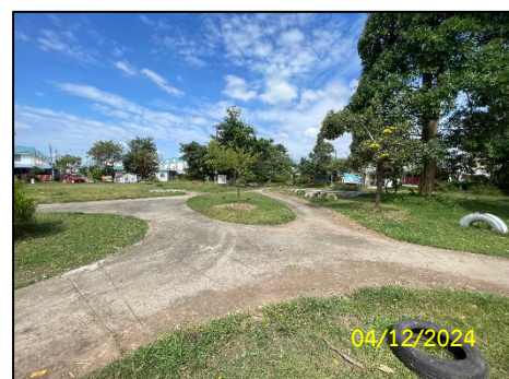
พื้นที่สวนสาธารณะ