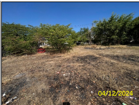
พื้นที่ก่อสร้างโรงเรียนอนุบาล