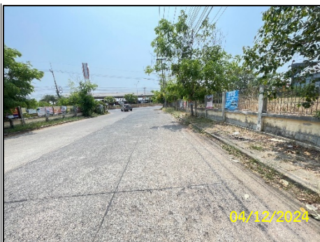
พื้นที่ถนน-ทางเท้า