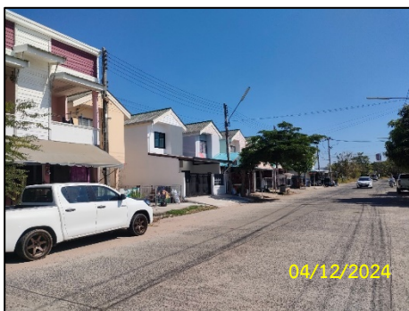
ทิศเหนือ